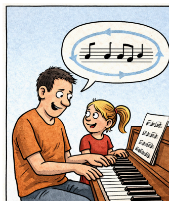
Riff, który spaja pokolenia