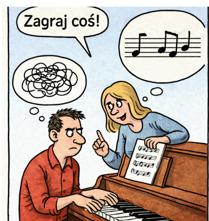
Riffy rozwiązują problem